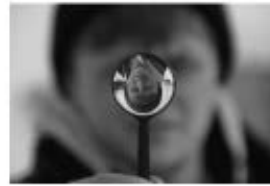
точка авторского зрения

«Мы исчерпали материал и нашли в нем много такого, о чем наш гипотетический студент мог бы доложить преподавателю, если бы описывал стихотворение не беспорядочно, а систематически – по уровням. Не нужно думать, будто филолог умеет видеть и чувствовать в стихотворении что-то такое, что недоступно простому читателю. Он видит и чувствует то же самое, – только он отдает себе отчет в том, почему он это видит, какие слова стихотворного текста вызывают у него в воображении эти образы и чувства, какие обороты и созвучия их подчеркивают и оттеняют. Изложить такой самоотчет в связной устной или письменной форме – это и значит сделать анализ стихотворного текста».